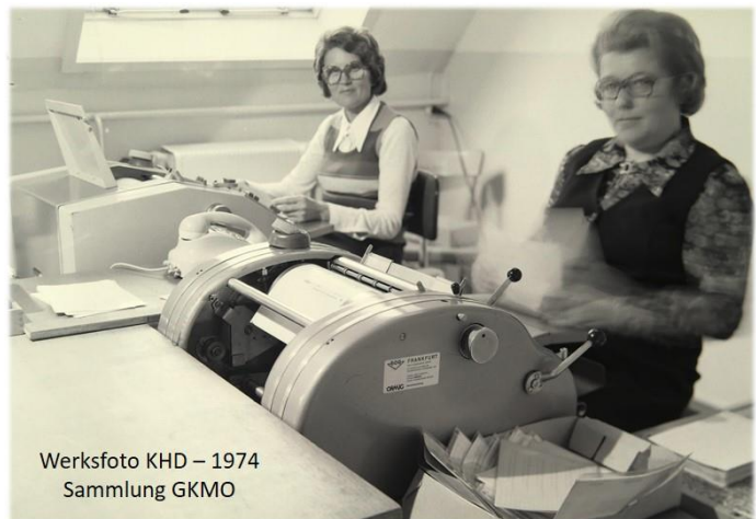
Werksfoto KHD – 1974 Sammlung GKMO

In vielen anderen der in den 1950er Jahren in Oberursel wieder aufblühenden Industriebetriebe waren Frauen in größerem Umfang beschäftigt, auch in den Produktionsbereichen beispielsweise der Textil-, Elektro-, Metallverarbeitungs- und Glasindustrie. In der Motorenfabrik konnten sich die Verhältnisse erst dauerhaft ändern, als Ende 1958 die Turbinengruppe der KHD AG von Köln in das nach Behebung der Besetzungsschäden wieder voll nutzbare Oberurseler Werk verlegt worden war, und nachdem bald darauf der Einstieg in das Flugtriebwerksgeschäft erfolgte. Diese beiden Ereignisse hatten den Aufbau eines differenzierten Entwicklungsbereichs und einer umfassenden kaufmännischen Verwaltung zur Folge – und damit ein deutliches und nachhaltiges Anwachsen der Frauenbeschäftigung. In der nun breiter gegliederten Organisation, mit drei und später vier Hauptressorts und ihren nachgeordneten Organisationseinheiten, entstanden Stellen für die Bereichs- und Abteilungssekretärinnen, zu deren wesentlichen Aufgaben auch die Erledigung der gesamten und vielfältigen Betriebs- und Geschäftskorrespondenz gehörte. In der kaufmännischen Verwaltung, zu der auch der Einkauf, der Personalbereich und das Lagerwesen gehörten, wurde ein Großteil der Stellen von Frauen eingenommen, die mit einer anderenorts erworbenen Ausbildung kamen oder die am Arbeitsplatz angelernt wurden. Im Entwicklungsbereich