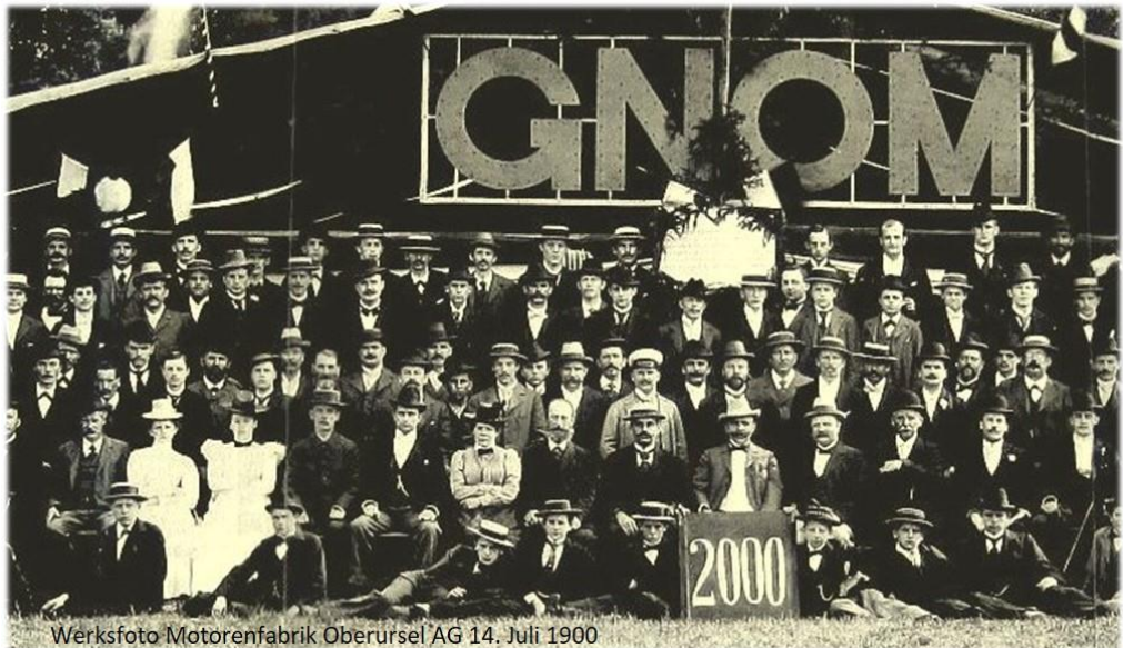
14. Juli 1900

Für die Zeit des Ersten Weltkriegs ist erstmals konkret belegt, dass hier Frauen auch im Produktionsbereich beschäftigt waren. Diese Kenntnis