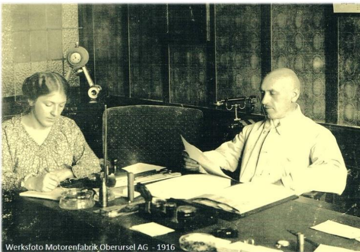
Werksfoto Motorenfabrik Oberursel AG - 1916

verdanken wir einem Besuch „Ihrer Majestät“ der Kaiserin im Dezember 1917. In der Zeitung Oberurseler Bürgerfreund vom 15. Dezember 1917 steht zu lesen, dass die Kaiserin siebzehn mit Namen und Tätigkeit aufgeführte Arbeiter, Vorarbeiter und Werkmeister mit dem von ihr gestifteten Kriegsverdienstkreuz ausgezeichnet hat, und weiterhin drei Frauen. Deren Tätigkeit war mit Dreherin, Bohrerin und Kontrolleurin angegeben, also typischen Produktionstätigkeiten. Für die damals kriegswichtigen Flugmotoren waren auch viele kleinere und leichtere Bauteile herzustellen, an denen Frauen wohl problemlos eingesetzt werden konnten. Generell hat in der kriegsbedingten Rüstungsproduktion die Frauenbeschäftigung zwar deutlich zugenommen, am Gesamtbild hat dies jedoch nur wenig geändert, da es vor Allem zu einer Umschichtung von zuvor in den Konsumgüterindustrien arbeitenden Frauen gekommen war. Das den Kriegsbedingungen geschuldete Hineinwachsen von Frauen in bisherige berufliche Männerdomänen wird übrigens als einer der Gründe für die Einführung des Frauenwahlrechts in Deutschland genannt, das erstmals zur Wahl der Deutschen Nationalversammlung im Januar 1919 zum Tragen kam.